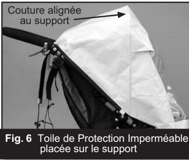
Fig. 6 Toile de Protection Imperméable placée sur le support