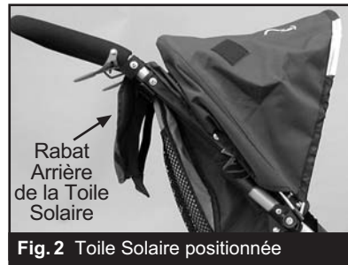
Fig. 2 Toile Solaire positionnée