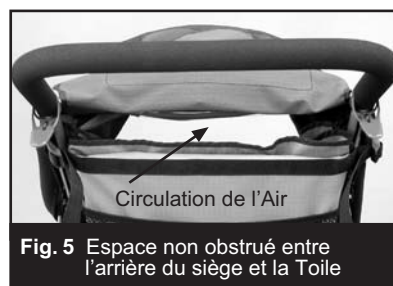
Fig. 5 Espace non obstrué entre l'arrière du siège et la Toile

C) Rabattez le rabat de la toile vers l'avant et attachez-le à la bande Velcro qui se trouve sur la toile solaire, tel que cela est indiqué en Fig.4. Remarque: les instructions concernant le rabat de la toile solaire décrivent également cette étape essentielle. D) Inspectez l'ouverture à l'arrière de la poussette (voir Fig. 5), afin de vous assurer que l'espace permettant la circulation de l'air, entre le haut du dos du siège et la toile, n'est pas obstrué.