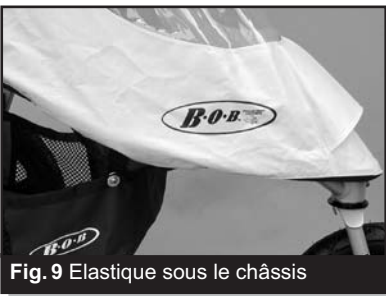
Fig. 9 Elastique sous le châssis