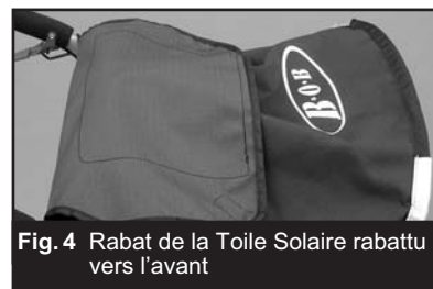
Fig. 4 Rabat de la Toile Solaire rabattu vers l'avant