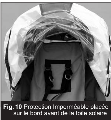
Fig. 10 Protection Imperméable placée sur le bord avant de la toile solaire

cordons élastiques autour du bouton anti-choc noir (du même côté que la boucle), tel que cela est indiqué en Fig.7 (Côté droit illustré ici). Les autobloquants du cordon permettent d'agrandir ou de réduire la taille de la boucle, réglant ainsi la tension du cordon.