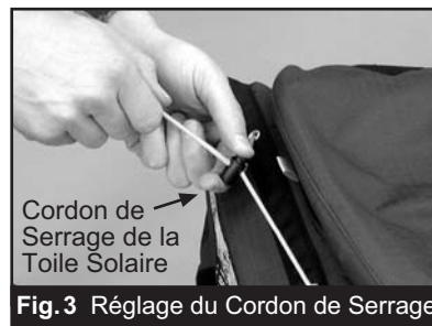
Fig. 3 Réglage du Cordon de Serrage