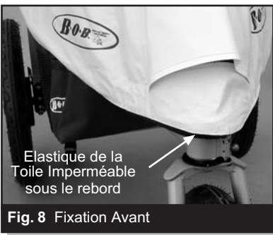
Fig. 8 Fixation Avant