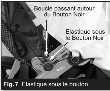
Fig. 7 Elastique sous le bouton