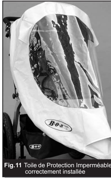
Fig. 11 Toile de Protection Imperméable correctement installée

7. Pour installer votre enfant dans la poussette, retirez le dessus de la Toile de Protection Imperméable de la poussette et faites-le passer par dessus le bord avant de la toile solaire (voir Fig. 10). Ceci tiendra temporairement la protection imperméable à l'écart et vous permettra de mieux